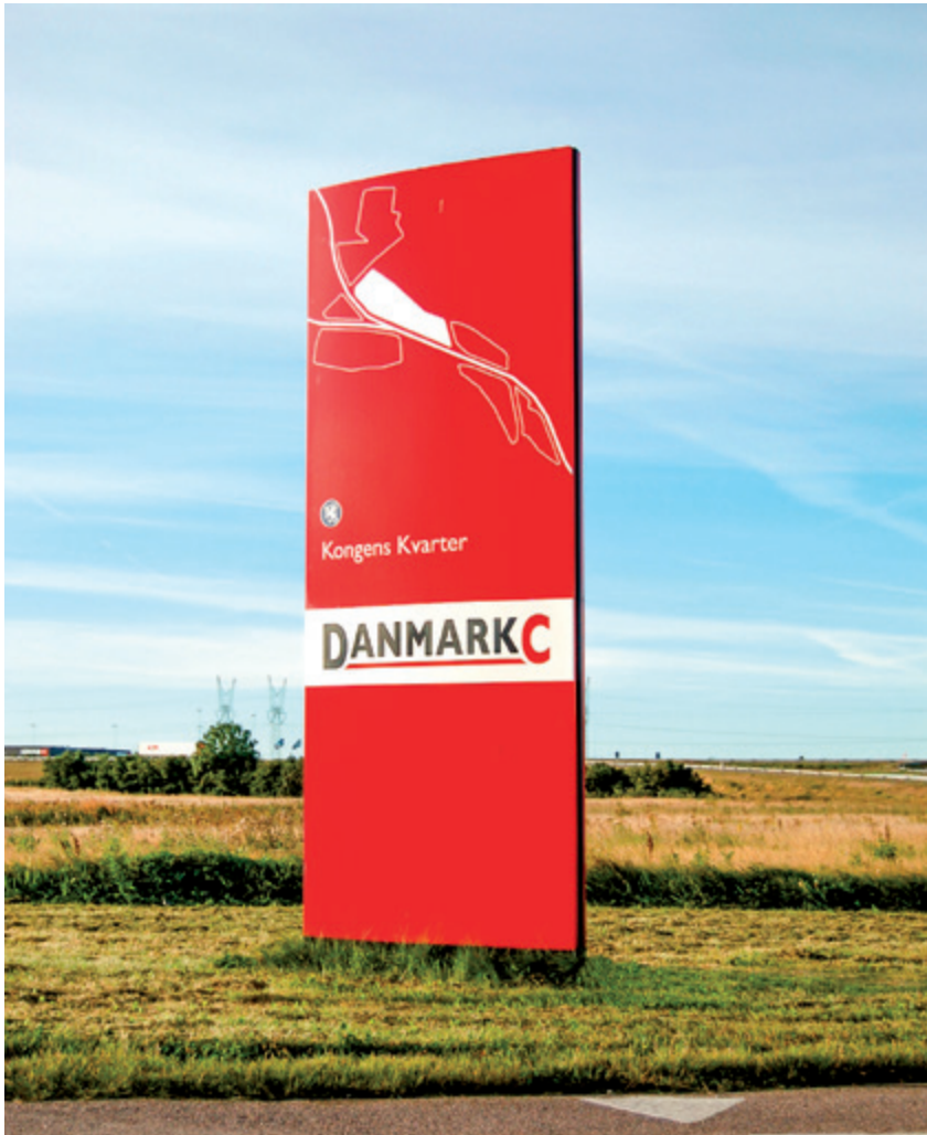
Basepylon 1400x3000mm lakeret i RAL farve efter opgave.

Pylon Base er opbygget på to ben, og de leveres i flere forskellige farver og størrelser. Der kan RAL lakeres efter opgave.