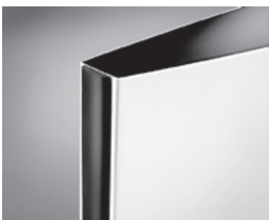
Gummiliste som side afslutning.